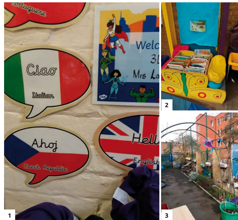
Obr. 1 - žáci jsou z celého světa Obr. 2 a 3 - venkovní část třídy Fotografie pořízeny s laskavým svolením ředitelky St Mary's Catholic Primary School. http://www.st-marys.merton.sch.uk

Zdroje: http://www.st-marys.merton.sch.uk/About-Us-sma ; https://www.nspcc.org.uk/preventing-abuse/child-protection-system/england/legislation-policy-guidance/