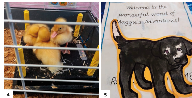
Obr. 4 a 5 - zvířátka ve škole a deníček školního psa