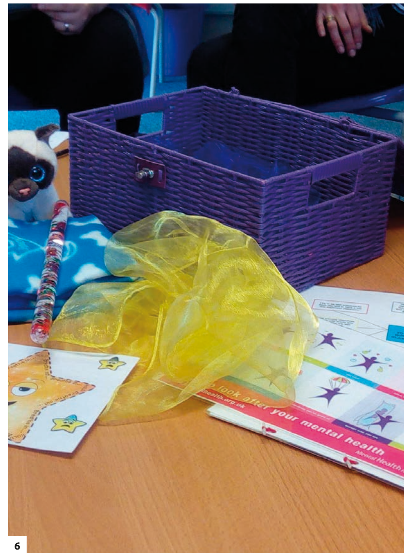
Obr. 6 – nurture box

V každé třídě je dětem k dispozici tzv. NURTURE BOX, ve kterém jsou různé předměty (deka, plyšák, různé relaxační pomůcky, obrázek s návodem, jak zklidnit dech apod. – viz foto). Box je ve třídě volně k dispozici, a pokud má dítě nějaký problém či potřebu, vezme si z něho, co právě potřebuje. Děti box využívají, když jsou smutné, nejisté, mají vztek, strach apod. Učitel nebo výchovný poradce může s dítětem pracovat na zkoumání jeho pocitů prostřednictvím pomůcek z boxu a dítě nemusí opouštět třídu či dokonce být posláno domů.